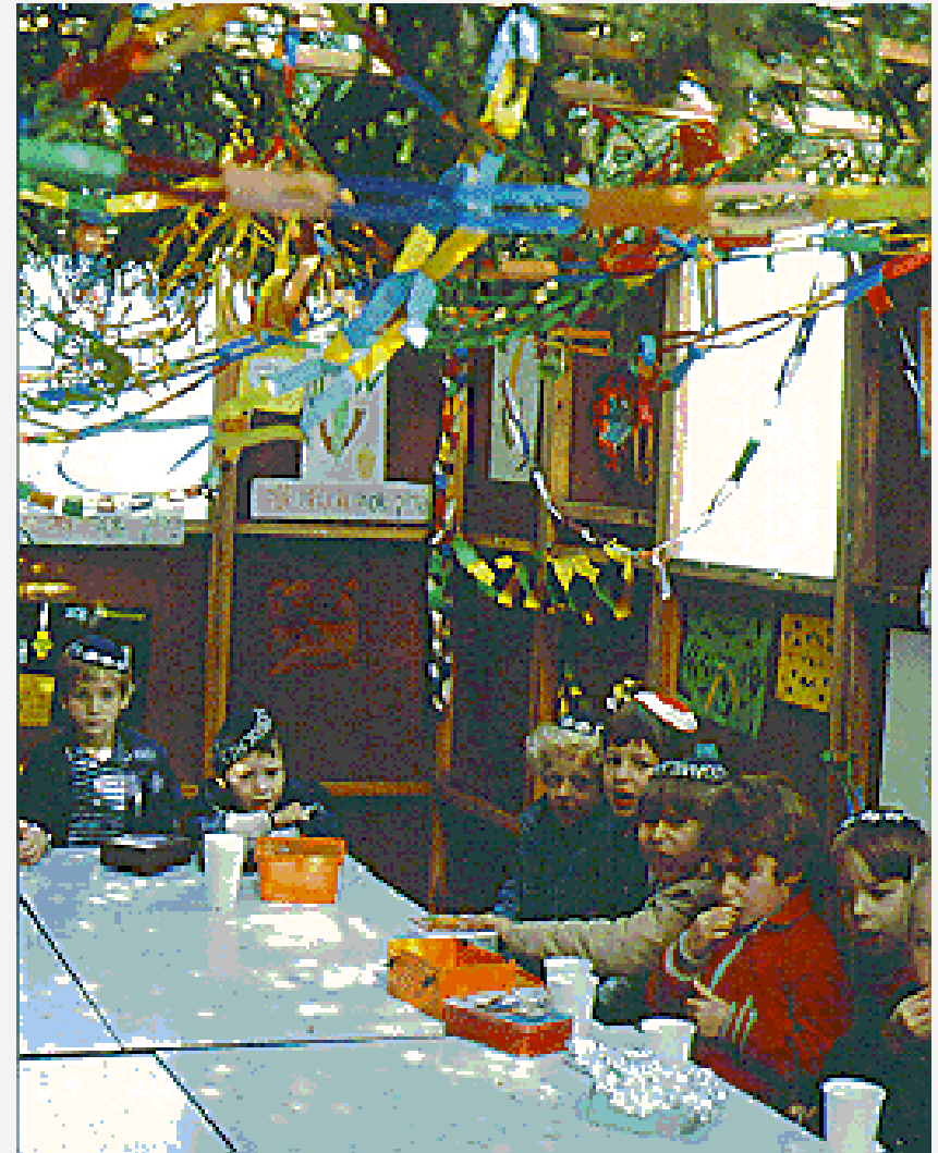
Sukkot at the Jewish day school in Copenhagen