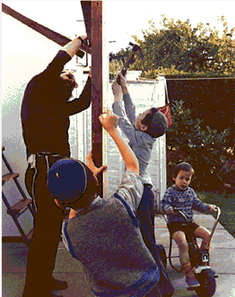
Children helping to build the sukkah . London, England, 1980